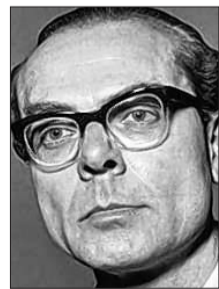
Arno Schmidt (1914-1979).